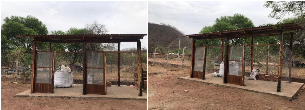
Figura 4. Centro de acopio temporal de residuos inorgánicos

Respecto a los residuos inorgánicos que son generados en la comunidades de Eiti y Gutierrez Pueblo se han priorizado los papeles, cartones, plásticos y aluminio, debido a que estos son los que son generados en su mayoría. El material de fabricación de estas estructuras fue de madera tratada y una malla metálica para evitar el ingreso de roedores a estos espacios, además de una base de hormigón con un sistema de drenaje para lixiviados para evitar el contacto de los residuos con el suelo; así mismo cada centro de acopio cuenta con una capacidad de 12 m 3 y configurada en dos módulos independientes de 6 m 3 de capacidad, considerando las siguientes dimensiones: 2 metros x 2 metros y un altura máxima de 1,5 metros.