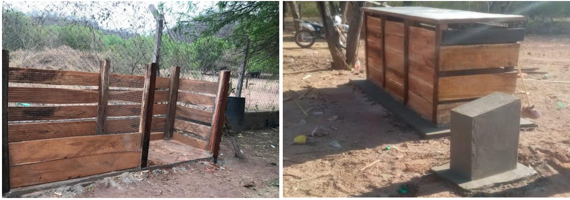
Figura 3. Compostera comunal del GAIGKI

El material de fabricación de estas estructuras fue de madera tratada y una malla metálica para evitar el ingreso de roedores a estos espacios, además de una base de hormigón con un sistema de drenaje para lixiviados para evitar el contacto de los residuos con el suelo; así mismo de acuerdo con la experiencia de operaciones de compostaje se ha identificado un tiempo de residencia de 45 días para la culminación de proceso con una aireación manual a través de agitación y una hidratación mediante el regado de las pilas conformadas.